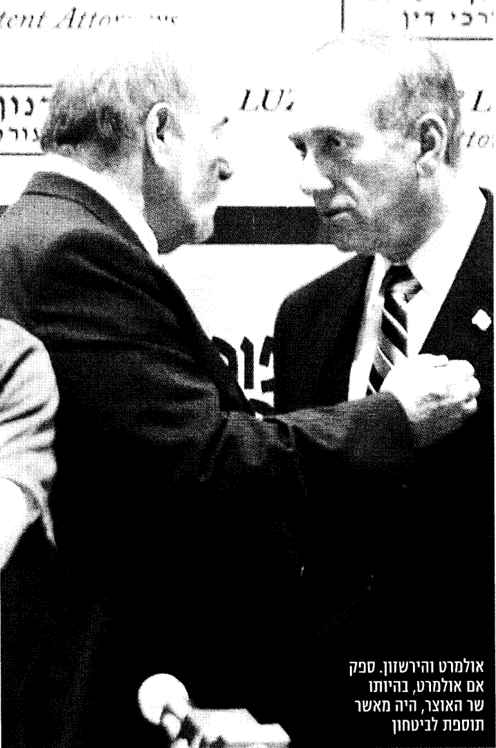
אולמרט והירשזון. ספק אם אולמרט, בהיותו שר האוצר, היה מאשר תוספת לביטחון

בעקבות דרישת מערכת הביטחון אישר אולמרט הגדלת התקציב ב-1.9 מיליארד שקל